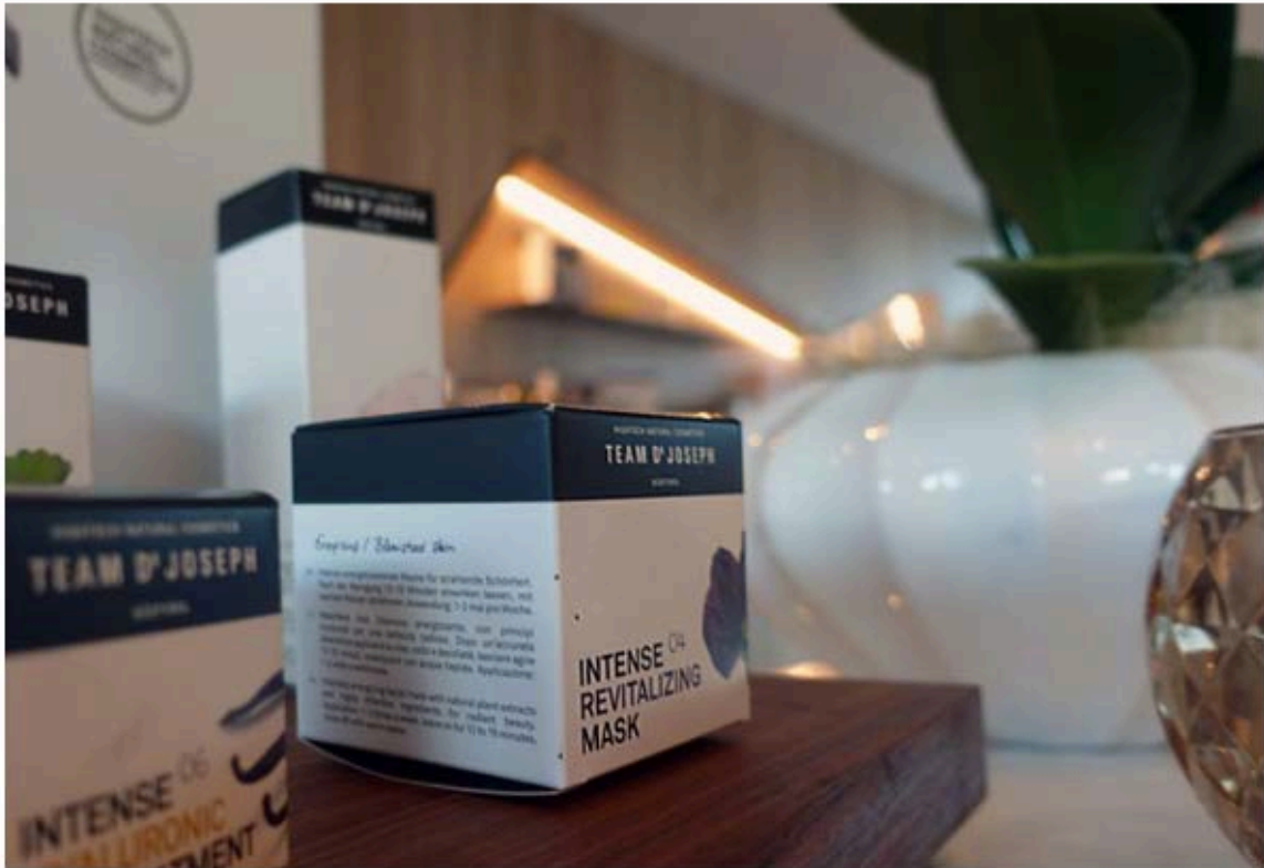
Naturkosmetik von Team Dr. Joseph