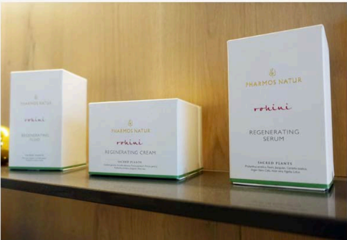
Naturkosmetik von Pharmos Natur

Hier könnt ihr euch weitere Eindrücke vom Hotel verschaffen.