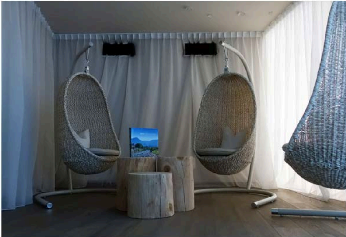
Entspannung nach dem Saunagang