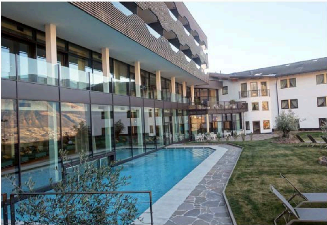
Der großzügige Außenpool

Neben den Mahlzeiten hatten wir uns kein festes Programm für dieses Wochenende vorgenommen – denn wir wollten ja hauptsächlich entspannen. Also verbrachten wir die Tage größtenteils im Wellnessbereich mit großzügigen Liegen, grandiosem Außen-Pool und moderner Sauna-Anlage. Anstatt dem gängigen Chlorwasser verfügt dieses Hotel über ein großes Sole-Becken. Das Wasser wird also nicht mit Chemie sauber gehalten, sondern ganz natürlich mit Salz, sodass hier auch Personen mit Hautproblemen bedenkenlos eintauchen können. Da ich sonst kaum die Möglichkeit habe, im ungechlorten Nass zu schwimmen, habe ich es dort voll und ganz auskostet.