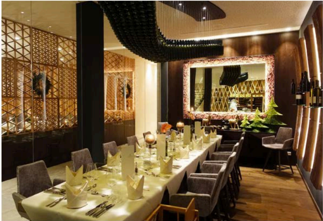
Speisesaal mit Deckenkonstruktion aus Weinflaschen