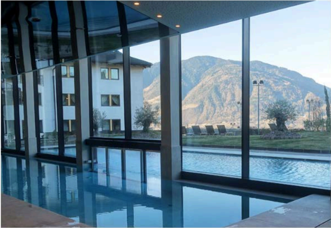
Außenpool mit Blick in die Berge