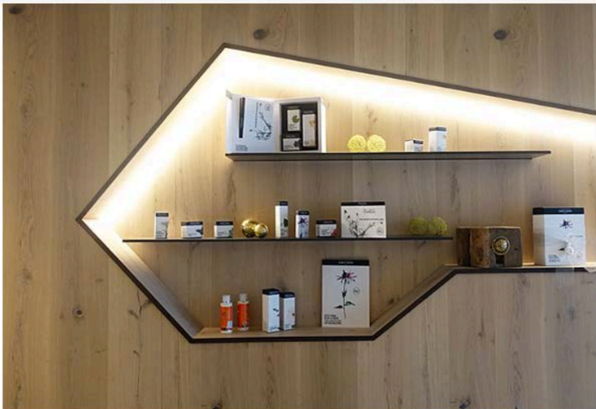
Hier wird mit der Naturkosmetik von Team Dr. Joseph gearbeitet

Ein weiteres Highlight war das Beauty-Treatment, das ich mir gegönnt habe. Dafür nutzt das Hotel ausschließlich Naturkosmetik der Marken Team Dr. Joseph und Pharmos. Ich entschied mich für eine klassische Gesichtsbehandlung mit den Produkten von Team Dr. Joseph, die – Achtung es wird mal wieder regional – aus Südtirol stammen. Selbst bezeichnet sich die Marke als Hightech natural cosmetics, was sich meiner Meinung nach auch in den modernen Verpackungen widerspiegelt. Ob sich dies auch in der Wirkung zeigt, kann ich nach einer einmaligen Anwendung natürlich nicht beurteilen. Jedoch fühlte sich meine Haut nach der 50-minütigen Behandlung inklusive Peeling, Peel-Off-Maske, Creme, Lippen- und Augenpflege extrem weich, gut durchfeuchtet und richtig beruhigt an. Gepaart mit einer Schröpfmassage (ebenfalls im Gesicht), sorgte das Intense Purifying Face Treatment von Team Dr. Joseph insgesamt für einen tiefenentspannenden Abschluss der Reise.