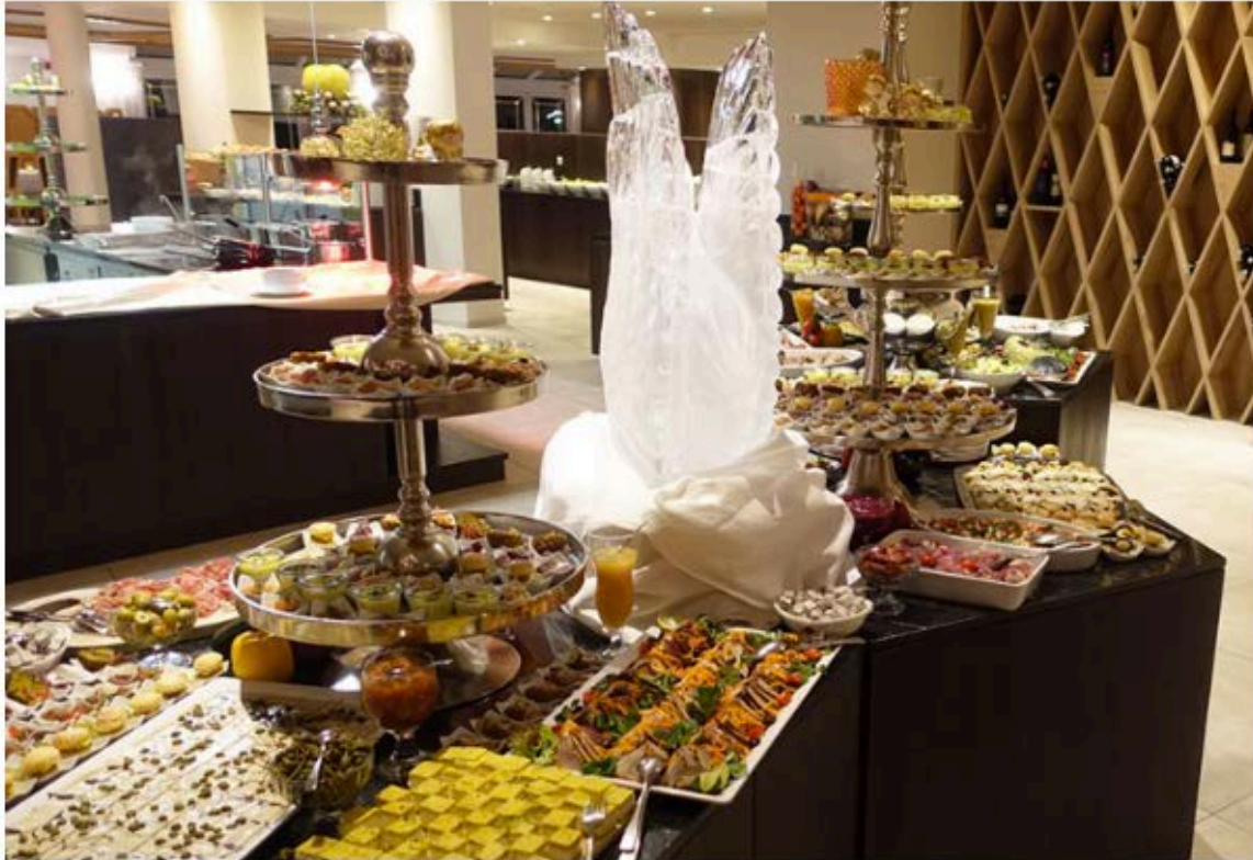
Teil des Buffets